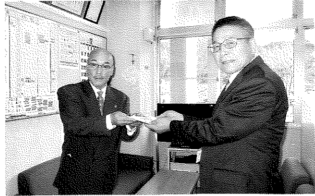
石川ライオンズクラブ