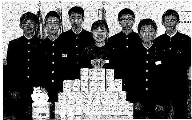
ひらた清風中学校